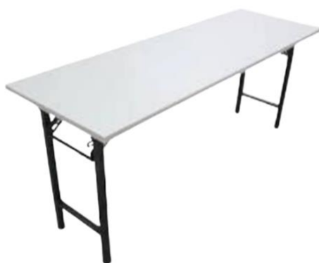
長枱 (約1.52米 x 0.61米)